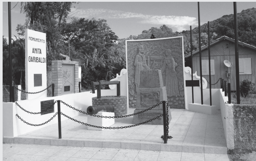
O monumento Anita Garibaldi é um dos atrativos da região da Madre